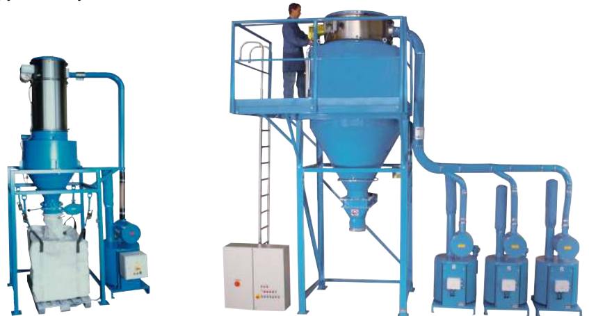
от 5.5 до 44 кВт

делают доступным вакуум на рабочих местах, позволяют оперативно и без пыления возвращать в производство технологическое сырье. Благодаря системе трубопроводов с производительностью, рассчитанной для конкретного производства, вакуумная очистка производится на большом удалении от вакуумного агрегата (источника вакуума), что позволяет проводить уборку на различных этажах и в труднодоступных местах.