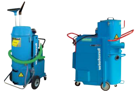
IS-30 SV, 3 кВт

Передвижные промышленные пылесосы. Wieland предлагает и дорогие и малобюджетные агрегаты для вакуумной уборки помещений, очистки производственного оборудования и высокоскоростного пылеудаления.