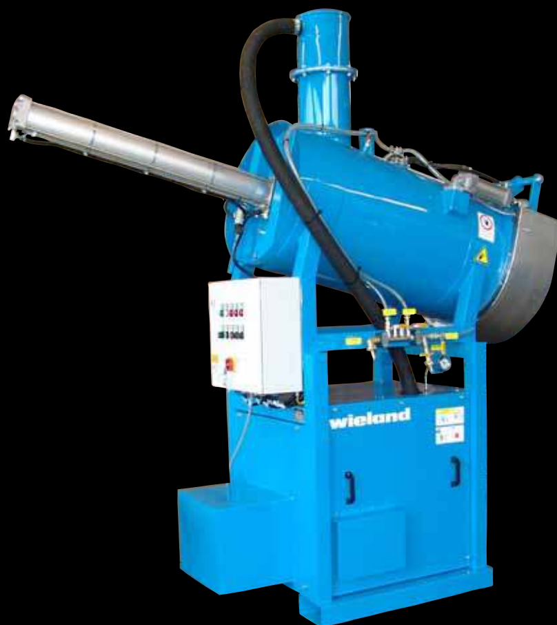
Очиститель смазки и картеров FA-450