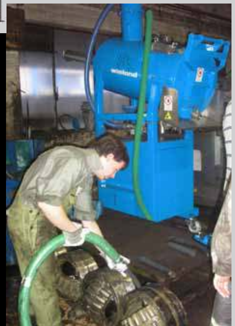
Всасывание смазки из подшипников на металлургическом заводе