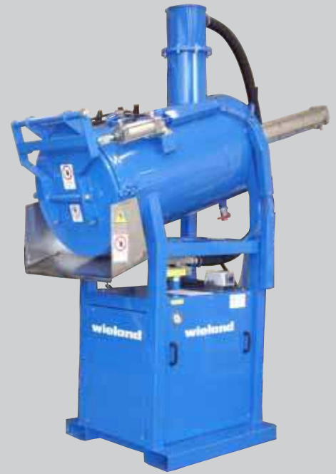
Стационарное исполнение, мобильное исполнение под заказ