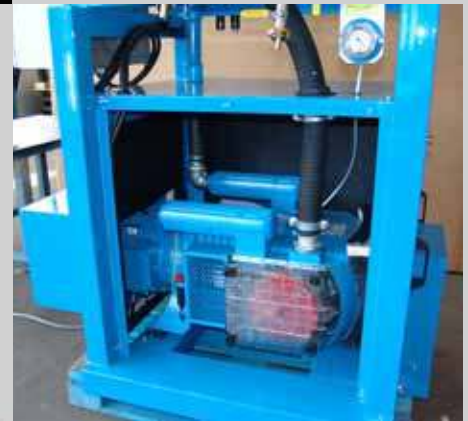
Высокопроизводительный вакуумный насос, низкие эксплуатационные расходы