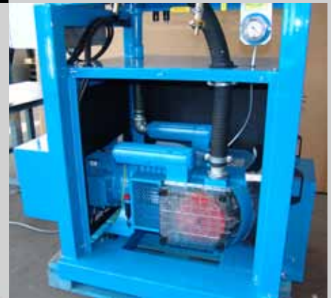
Высокопроизводительный вакуумный насос, низкие эксплуатационные расходы