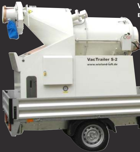
VacTrailer S-2 в транспортном положении

Легкая транспортировка любым видом транспорта, даже легковым а/м. Общий вес с прицепом ~ 1100 - 1300 кг.