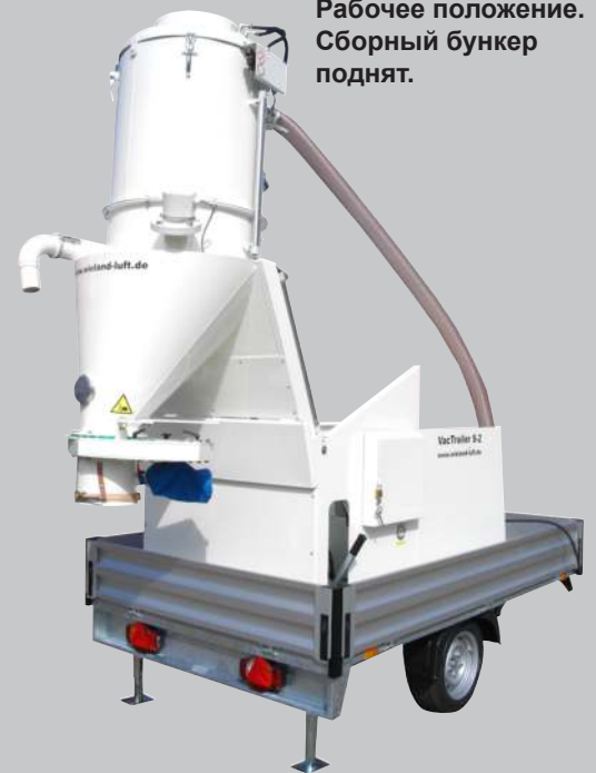
Рабочее положение. Сборный бункер поднят.

Возможность работы 2-х операторов одновременно шлангами DN 60 мм или одного оператора шлангом DN 80 мм.