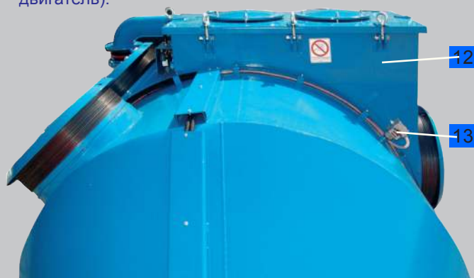
На рисунке видны: секция основного фильтра с системой автоматической регенерации фильтра AirShock® , клапан сброса избыточного давления взрыва, датчик уровня заполнения бункера