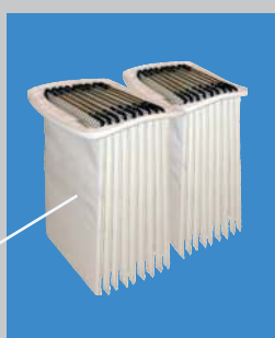
Карманный фильтр с тефлоновым покрытием, со вставками, предотвращающими залипание карманов.