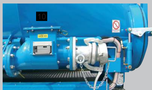
Клапан взрывозащиты. Мгновенно закрывает сечение вакуумного трубопровода в случае взрыва в сборном бункере и предотвращает распространение пламени и взрывной волны по трубопроводу.